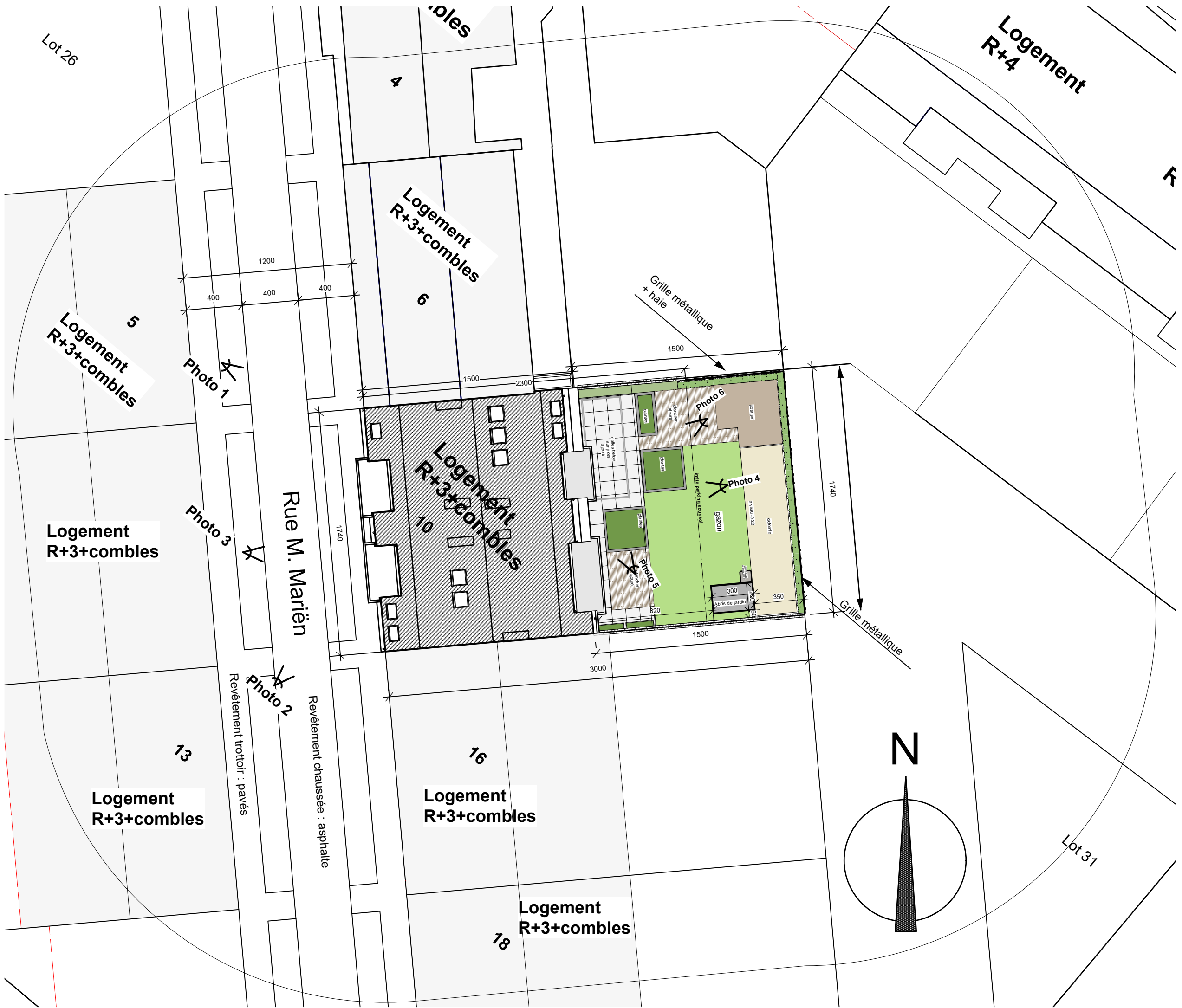
PLAN D'IMPLANTATION éch 1-250